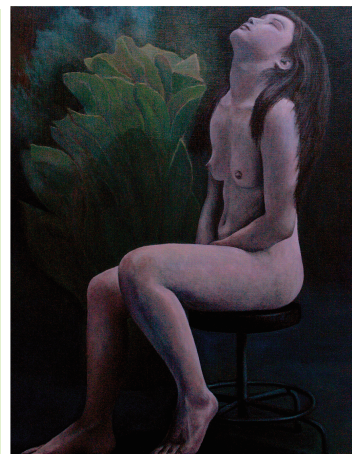
京セラ美術館 2022 年持田賞受賞作品

マロニエ美術造形教室広島三次駅前 LAWSON 横 728-0013 広島県三次市十日市東 1-5-7